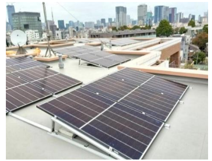
弊社導入事例（東京都港区）